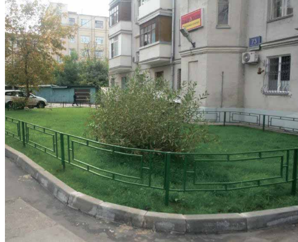
слева направо: Новослободская улица, д. 73 2-й Щемилловский пер., д. 16/20