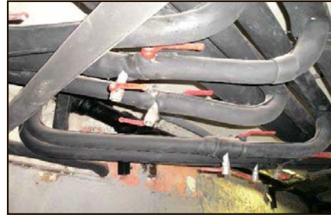
слева направо: Шелепихинское ш., д. 17, к. 1 Брошевский пер., д. 8 Ул. Павла Андреева, д. 28, к. 7