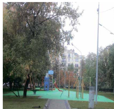
слева направо: Вишняковский пер., д. 23 Ковров пер., д. 4, к. 1 1-й Вражский пер., д. 4