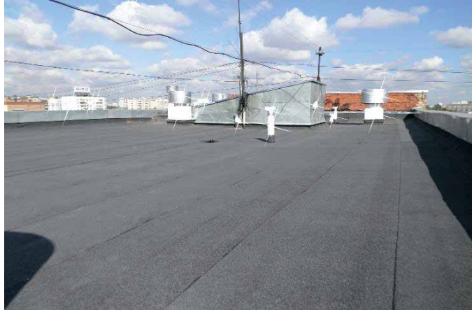
слева направо: Новокузнецкая ул., д. 43/16 Трифоновская ул., д. 57, к. 1