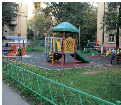
слева направо: М. Сухаревская пл., д. 1 Токматов переулок, д. 3-5 Госпитальный Вал, д. 5, к. 16